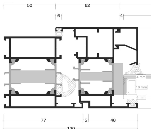
MB-77 HI: RAHMEN MIT FLÜGEL